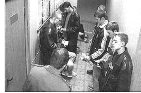
Остановимся, переведем дух. Дадим خود мыслям – у кого они уже появились. И – продолжим чтение.