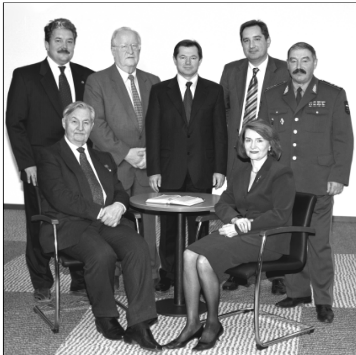
На фото (слева направо): Сергей БАБУРИН, Виктор ГЕРАЩЕНКО, Сергей ГЛАЗЬЕВ, Дмитрий РОГОЗИН, Георгий ШПАК, Валентин ВАРЕННИКОВ, Наталья НАРОЧНИЦКАЯ

В воскресенье 7 декабря состоятся выборы в Государственную Думу Российской Федерации. Нам предстоит решить, кому мы доверим свою судьбу и судьбу России. Мы предлагаем поддержать людей, доказавших всей своей жизнью, что они любят свою Родину, хотя и могут работать на ее благо. Поддержите самую патриотичную и самую профессиональную команду, которая когда-либо участвовала в выборах.